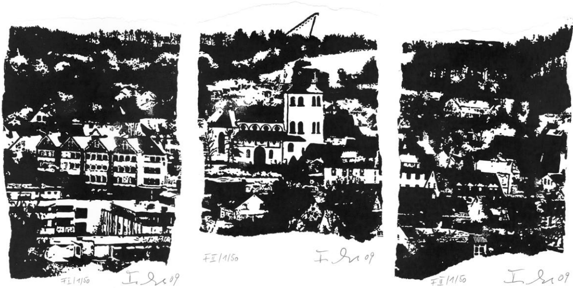
Dieter Fuchs, "Meinerzhagen", Linolschnitte, 3 x 50 (Fragmente), alle handgedruckt und handsigniert

des Evangelischen Gymnasiums Meinerzhagen